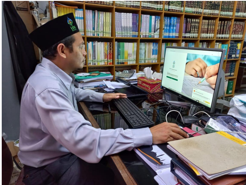
(posisi kamera hp untuk zoom harus dapat memperlihatkan tubuh peserta dan layar laptop/pc sekaligus)